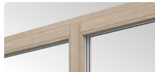
Smala profiler med smal mittstolpe är utrustade med dubbeltätning, vilket är en nyhet på marknaden vid sådana lösningar.