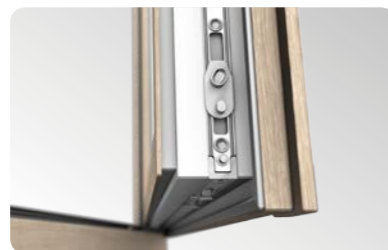
Högkvalitativt Maco Multi Matic KS beslag levereras som standard med två inbrottsäkra pluggar.